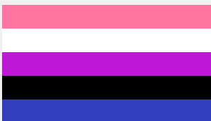
Bandera del orgullo género fluido

El presente documento tiene como finalidad aportar orientaciones docentes en torno al trabajo y trato con estudiantes en función del respeto irrestricto de su autodeterminación de género, con especial foco en estudiantes trans, intersexuales, de género fluido, no binaries u otros. Las orientaciones presentadas a continuación, se corresponden con el protocolo de uso de nombre social, también conocido como protocolo Mara Rita.