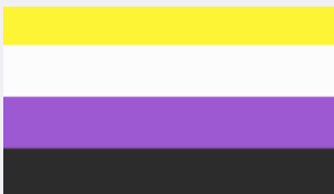
Bandera del orgullo no binarie