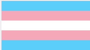
Bandera del orgullo trans