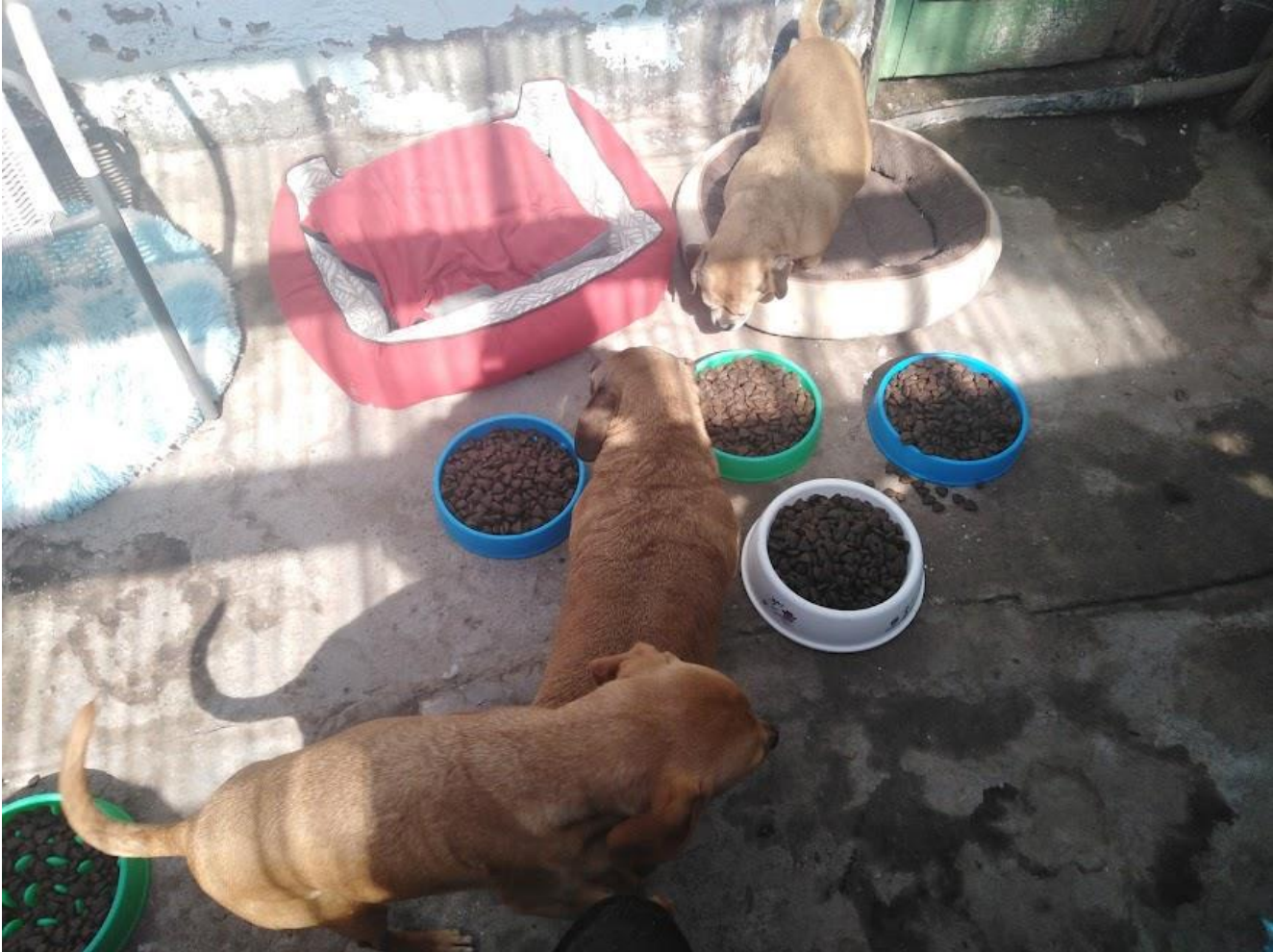
Foto N°3: Ágata, Galatea, Gala. Septiembre de 2022

Los gatos que tienen condiciones de salud que aún les permiten cierta independencia (ceguera, sordera, mutilaciones o amputaciones) están en la parte de la casa que antes se arrendaba y que fue ampliada para ellos, junto con la cocina. Luego, los parapléjicos están en la entrada de esa parte, aquí duermen con Bárbara en dos camas de dos plazas donadas, pues requieren vaciados de vejiga cada 4 o 6 horas y un lugar tranquilo para reposar.