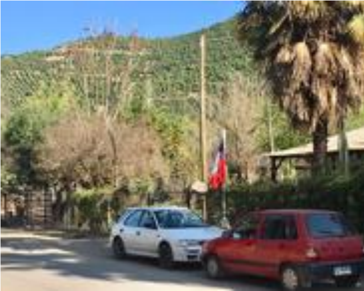
o n° 3: Cerro de Llay Llay, cubierto de hilera de cultivo de palta. pavez

familia porque los ha cercado”, tampoco se pueden hacer asados, disfrutar de la sombra de los árboles ni bañarse en el río, porque ahora está seco.