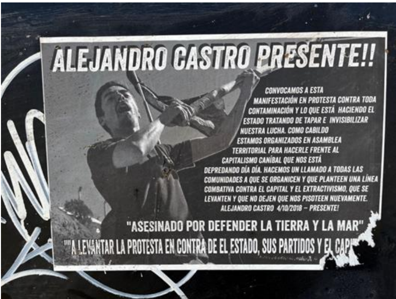
Figura 6. Cartel “Alejandro Castro Presente”. Elaboración propia.