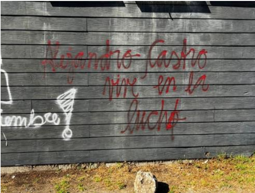
Figura 5. Graffiti “Alejandro Castro Vive en la lucha”. Elaboración propia.