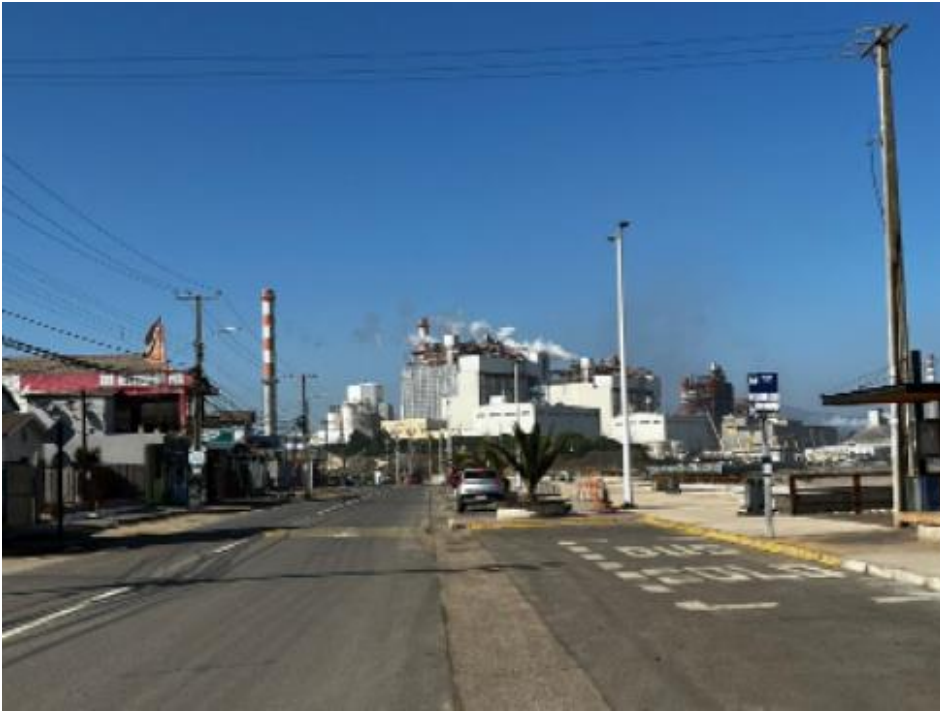
Figura 1. Calle principal Las Ventanas. Elaboración propia.

Es decir, su significado está descrito de forma explícita. Miles de habitantes de estas zonas no solo se resignan ante este estilo de vida irrumpido por la polución, sino también sacrifican su salud y bienestar y las de sus familias debido a aquello. En otras palabras, a pesar de esta oscura realidad, las personas parecen “aceptar su destino” o de manera coloquial, “bajarle el perfil” a sus consecuencias, al menos así lo demuestra una de nuestras entrevistadas, quién se mudó desde Santiago hacia Quintero: