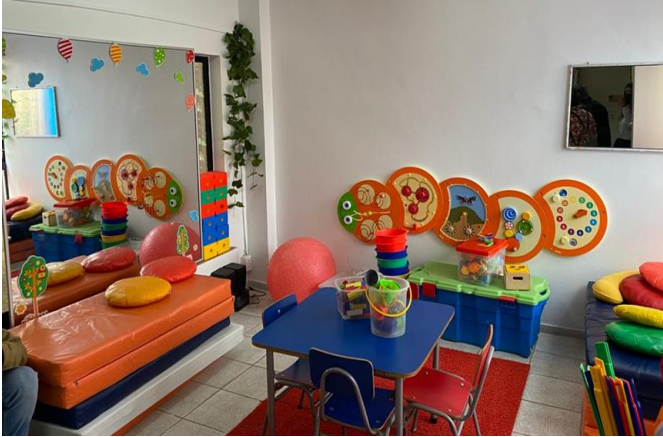
Figura 4. Sala Infantil CESFAM.

Los viajes a Coquimbo para realizarse exámenes como ecografías y atender el parto con el paso del tiempo se volvió una situación normalizada, debido a que en este lugar las madres encontraban todas las especialidades que son necesarias al momento de quedar embarazadas. “Claro, normalizado, porque allá tienen todo, los doctores, las matronas, todo al momento po y aquí no había nada antes po” (Amelia Maldonado, 83 años, jubilada, 26 de abril 2022, Tongoy).