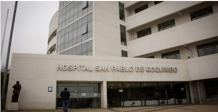
Figura 2. Hospital San Pablo de Coquimbo, Coquimbo, 2015.

Como indica la cita anterior, ha cambiado drásticamente la forma de realizar el seguimiento a las embarazadas a través de todo su proceso de gestación, hasta el momento del parto. Todo este avance con respecto al acompañamiento que se le hace a la futura madre por parte del aparato estatal, lamentablemente, queda opacado con la precaria situación en la que tiende a empujar la Municipalidad de Coquimbo a la localidad de Tongoy, donde la población de Tongoy es capaz de notar esta situación: "Sí, del municipio, Coquimbo, más bien es súper abandonado." (Clara Marín, 55 años aproximadamente, activista humedales, 27 de abril 2022, Tongoy). Es en esta situación en la que las mujeres son alentadas, y deben, tener sus hijos en Coquimbo. En el siguiente punto se va a entrar más en detalle en esto último.