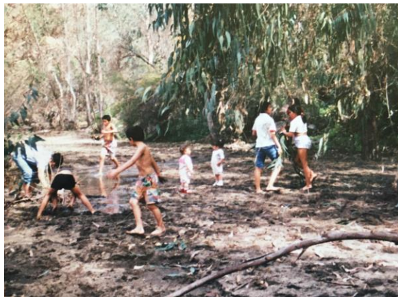
Foto nº2: “El Porvenir”. Cerca de 1992. Niños jugando en humedal La Colonia.