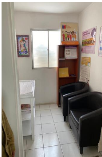
Figura 5. Sala Consulta CESFAM.

Sin duda, la labor hecha a nivel de estimulación temprana de la que el CESFAM hace partícipe no tan solo al infante, sino que se considera a los padres de este, lo cual es algo destacable. El programa “Chile crece contigo” cumple un rol sustancial y ejemplar en Tongoy, ayudando a los padres primerizos, así como otorgando las herramientas necesarias para manejar y dirigir de manera óptima el desarrollo cognitivo de sus hijos, para esto se hace una entrega de parte del programa de diversos materiales didácticos.