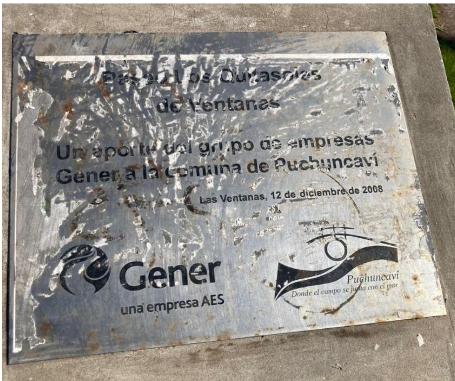
Figura 2. Placa conmemorativa inversión privada.

Estas empresas lo único que hacen es que por ley tienen que contribuir cierta cantidad de recursos a la comunidad poh', entonces, por ejemplo, este parque se construyó también por... obviamente con dinero del municipio, pero también de las empresas poh. (Trabajadora anónima de la Municipalidad de Quintero, 27/04/2022, Quintero)