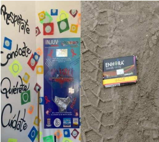
Figura 1. Publicidad y basura.

Para finalizar otros antecedentes importantes son características sociales que hemos encontrado en Tongoy, como puede ser una tensión entre la promiscuidad y el pudor, o sea que la gente está teniendo relaciones sexuales como lo puede denotar el viagra en las calles o la tasa ETS sin embargo el uso de preservativos o el tratamiento de estas se ve dificultado. //A la gente le da vergüenza ir al consultorio por esas cosas, siempre hay una vecina o algún familiar y no quieres que ellos sepan de esas cosas. // (Cuaderno de campo Vicente Villar, observación participante, 27 de abril 2022)