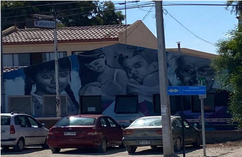
Figura 3. Mural que alude a la maternidad en CESFAM Tongoy.

//Ingrid nos comenzó contando los principales desafíos que tiene el CESFAM de Tongoy (la única institución encargada de la salud), nos contó que las madres no pueden parir en Tongoy, esto porque el CESFAM no cuenta con la implementación necesaria para asistir el parto, solo se hace un acompañamiento de la madre y el bebé durante todo el embarazo, los exámenes como las ecografías y el parto en sí, se hacen únicamente en Coquimbo, no en Tongoy.// (Cuaderno de campo Yuliana Menares, observación participante, 25 de abril 2022)