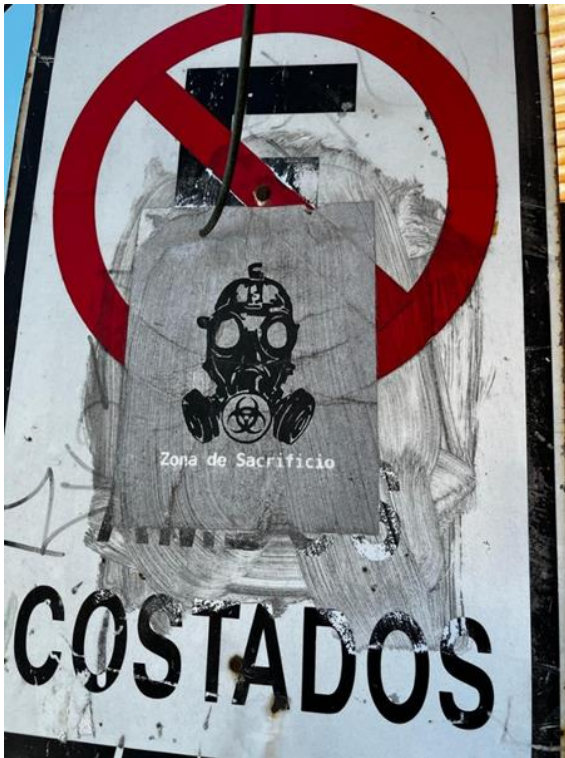
Figura 4. Afiche “Zona de Sacrificio”. Elaboración propia.

Pese a la normalización de la contaminación industrial por un grupo importante de los habitantes de las comunas de Horcón, Quintero y Puchuncaví, podemos ver que igualmente existe una posición activista en la población (Fig. 4).