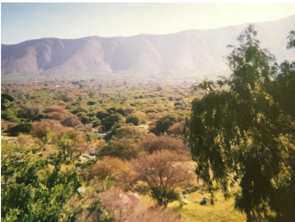
Foto nº1: Cerros de Llay Llay, cerca de 1992.

La familia extendida, lxs vecinxs, lxs amigos establecen lazos comunitarios, donde la intimidad parece exceder el lugar de la casa burguesa o la casa del consumo, donde la “intimidad” como espacio interior, sólo se consigue dentro de “cuatro paredes”.