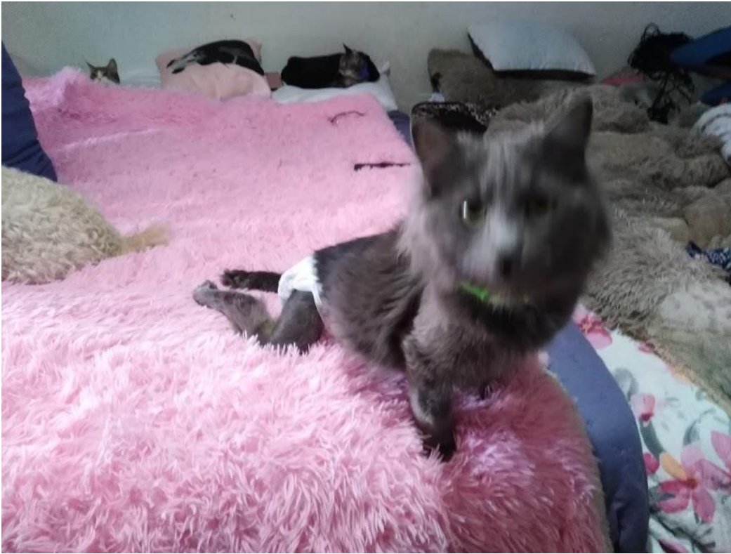
Foto N°1: Ceniza. Septiembre de 2022.

Se activan ante el estímulo de mi presencia, Ceniza se arrastra por el piso y sube a la cama gracias a sus fornidos brazos trabajados por el esfuerzo de cargar con su propio peso, para ser acariciado primero. Ser parapléjico en ningún caso implica inmovilidad, Ceniza es rápido, es fuerte, a veces logra gatear.