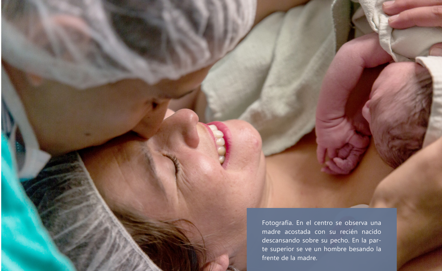
Fotografía. En el centro se observa una madre acostada con su recién nacido descansando sobre su pecho. En la parte superior se ve un hombre besando la frente de la madre.