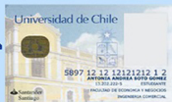
Tarjeta Universitaria Inteligente (TUI)