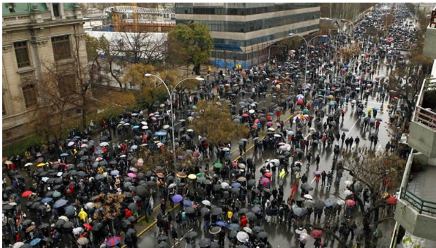
Miles de estudiantes chilenos se han movlizado en demanda de equidad en la educación y una mejor calidad.