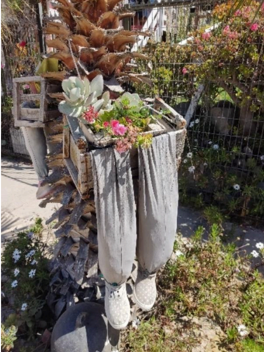
Figura 1: Cajonera “vestida” con pantalones y zapatillas. Contiene suculentas [ Crassulaceae ] y otras especies no identificadas.

Su dueño comentó que los pantalones y zapatillas correspondían a prendas que él había dejado de utilizar o que su familia había descartado, las cuales rellenaba con restos de otras prendas o con paja. Esta simpática característica, cargada de creatividad y humor, constituía un adorno más dentro del excéntrico jardín del caballero. En la fachada del jardín, por ejemplo, se exhibían cajones de madera a la venta, contruidos con siluetas de gallinas y cisnes. Asimismo, una diversidad de botellas plásticas se disponía horizontalmente y eran reutilizadas como maceteros, colgadas unidas por un hilo para albergar hiedras, montes y suculentas. A esto se sumaba la presencia de geranios - plantas que se encontraba frecuentemente en los jardines urbanos de Tongoy-, los cuales cubrían la reja exterior de la propiedad. Por su parte, margaritas, pencas, malvones, rayitos de sol y palmeras ocupaban el espacio que daba a la calle, configurando en conjunto un jardín polícromo y visualmente atractivo.