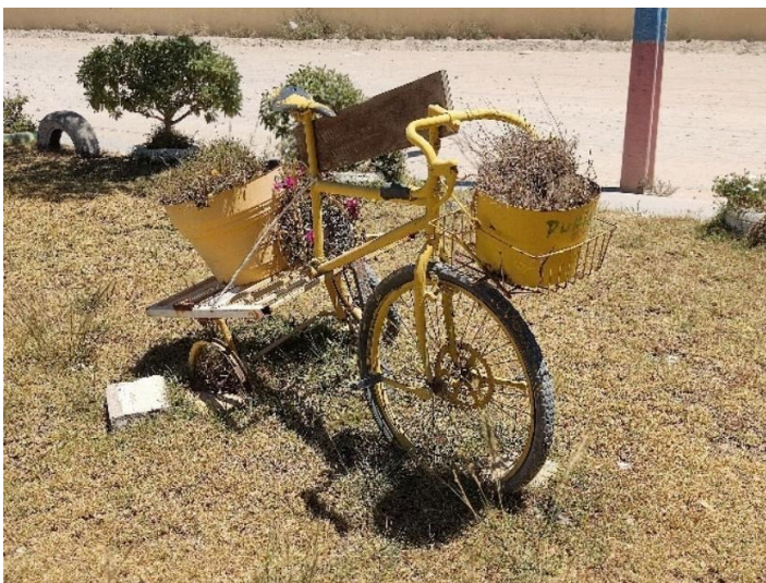
Figura 3: Triciclo de color amarillo ubicado al sector poniente de la Plaza Barnes.

En el transcurso de mi contemplación de la plaza, me percaté de una silla metálica de diseño antiguo y curvilíneo, que sostenía un cubo oxidado del cual brotaba un geranio invadido por pasto, que parecía ahogar a la planta principal. Me acerqué a tocar ambos objetos, percibiendo la adherencia y la plasticidad árida de la pintura del triciclo, sobre la cual reposaban plantas ásperas, rugosas y secas (Figura 3). En otro sector de la plaza, la corrosión del balde de color hueso se manifestaba como un desgaste evidente: la herrumbre se transfería a las yemas de mis dedos y produce un ruido hueco al contacto, lo que evocaba una sensación de vacío en el objeto y en el geranio que sostenía sobre sí.