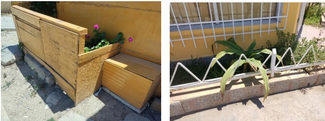
Figura 2: Jardines urbanos en la zona central de Tongoy. A la derecha, jardín con hiedra verde ( Hedera helix ) y geranios rosados ( Pelargonium zonale ); a la izquierda, jardín de pequeñas proporciones ubicado en la esquina de una vivienda.

Prontamente, ubiqué otro jardín que captó fuertemente mi interés. Este se ubicaba en la esquina de una vivienda y estaba delimitado por pequeñas cercas metálicas, con cerámica utilizada como recubrimiento. El parapeto cumplía la función de antejardín, a pesar de que ocupaba un espacio reducido y sin una delimitación clara con la vereda. El conjunto parecía estar descuidado y relativamente seco, con vegetación desordenada o dispersa; también presentaba malezas, pasto irregular y rejas oxidadas, destacando únicamente una palmera ubicada en el centro (Figura 2).