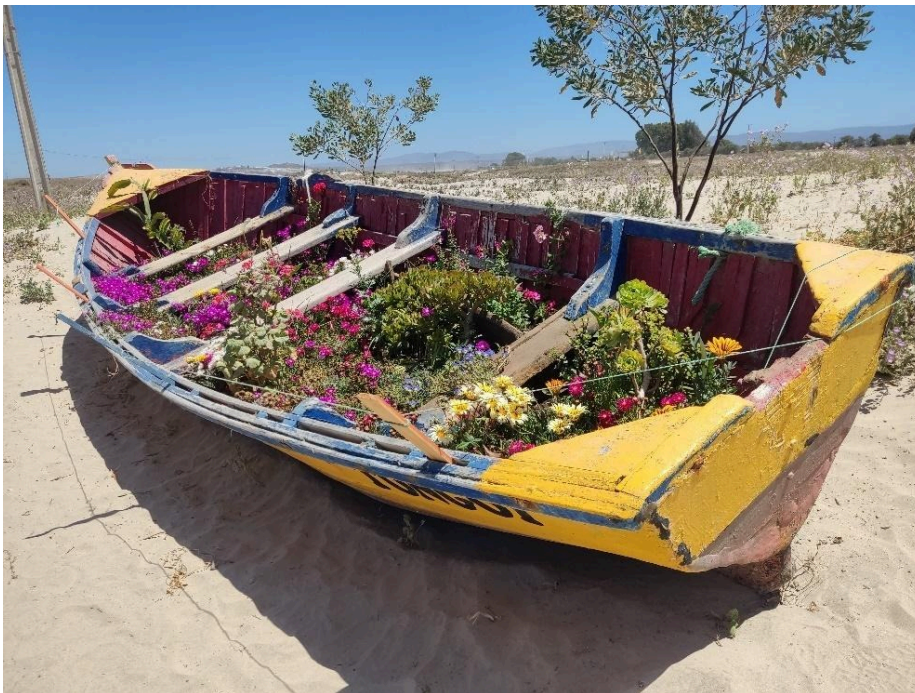
Figura 4: Lancha pesquera ubicada frente al parque Dolores Endeiza.

Rayitos de sol de sol, suculentas, margaritas, cactus y otras plantas -que no supe identificar- pintaban la superficie del barco de múltiples tonos de colores (Figura 4). El olor a arena y mar contribuía a configurar una estética singular en esta gran estructura que ahora funcionaba como un contenedor vegetal. La ausencia de una patente o nombre identificatorio en ella me llevó a pensar que la embarcación había sido destinada deliberadamente a este nuevo uso, o bien que su matrícula había sido borrada en función de su rol actual. Su disposición evocaba una estética propia del borde costero, remitiendo a observaciones previas, como el uso de boyas marinas convertidas también en maceteros al interior de algunos jardines del sector.