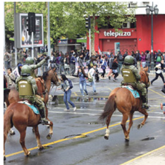
Carabineros a caballo dispersan una marcha tras el quiebre del diálogo entre los estudiantes y el gobierno.

hículos policiales. Giorgio Jackson, el presidente de la Universidad Católica, se sumaba a las críticas que a esa hora se multiplicaban en las redes sociales: "¡Se llevan detenidos y reprimen a estudiantes que bailan en la vereda...esto es impresentable!".