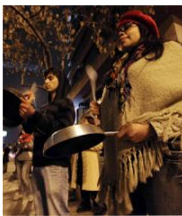
El ruido de cacerolas "tiene alcance político", pero sus consecuencias aún están por verse.

La protesta -que alcanzó una magnitud no vista desde los tiempos de la dictadura- es ahora motivo de reflexión, como la que realiza el sociólogo Aldo Mascareño, de la Universidad "Adolfo Ibáñez".