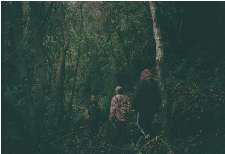
Figura 11: Recorriendo el Sendero Azkintuwe .

Fotografía: Constanza Anker, Recorriendo el sendero Azkintuwe , Pucura, 08 de mayo de 2024.