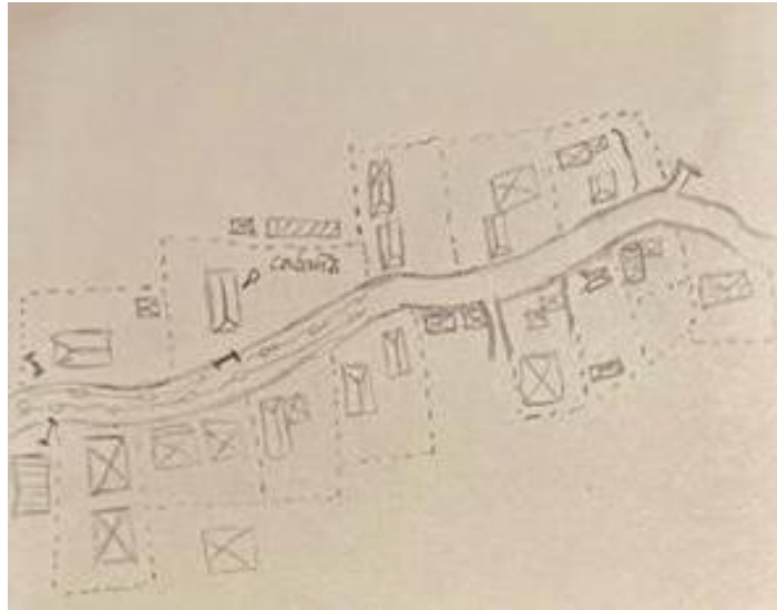
Figura 1: Parte 1 del mapa del camino de nuestra cabaña en Pucura hasta el Sendero Azkintuwe . [dibujo]: Martín Araya, Mapeo del sector, Pucura, 09 de mayo de 2024.