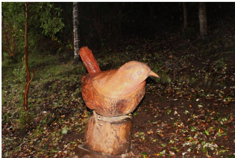
Figura 10: Escultura del Chucao

Fotografía: Fernanda Soto, Pitú, Pucura, 08 de mayo de 2024.