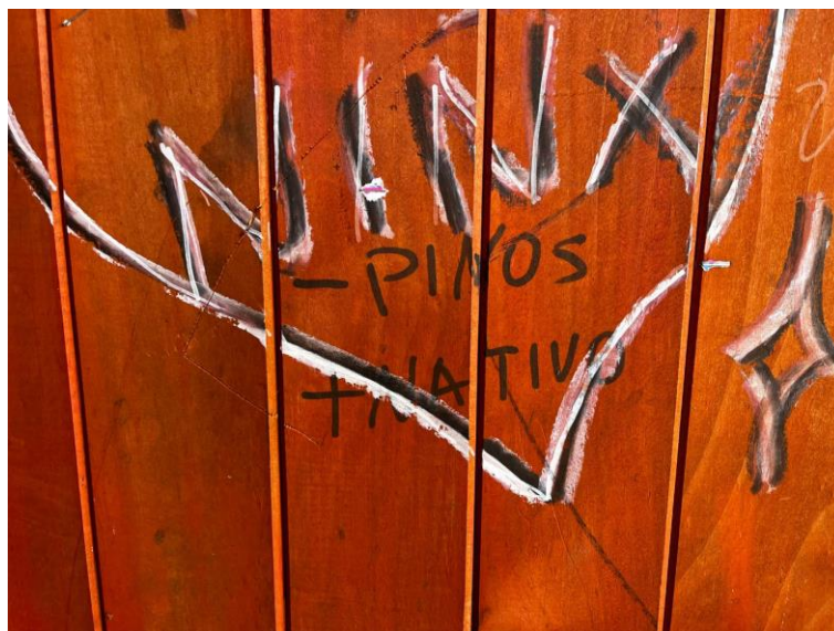
Figura 6: Pinos/Nativo

Fotografía: Fernanda Soto, Paradero Playa Pucura, Pucura, 07 de mayo de 2024.