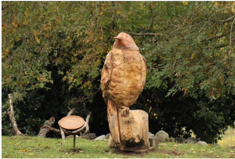
Figura 9: Escultura del Pitú.

Pitú, Pucura, 08 de mayo de 2024.