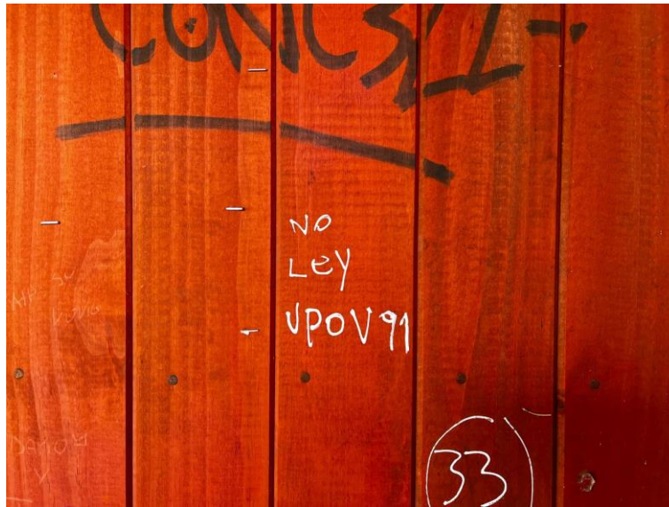
Figura 5: Rayado No Ley.

relacionadas, ¿Quién o quiénes las han escrito? No hay manera de saberlo, pero, en cualquier caso, se ve que paraba en un espacio movlizado, o afectado por la contaminación local.