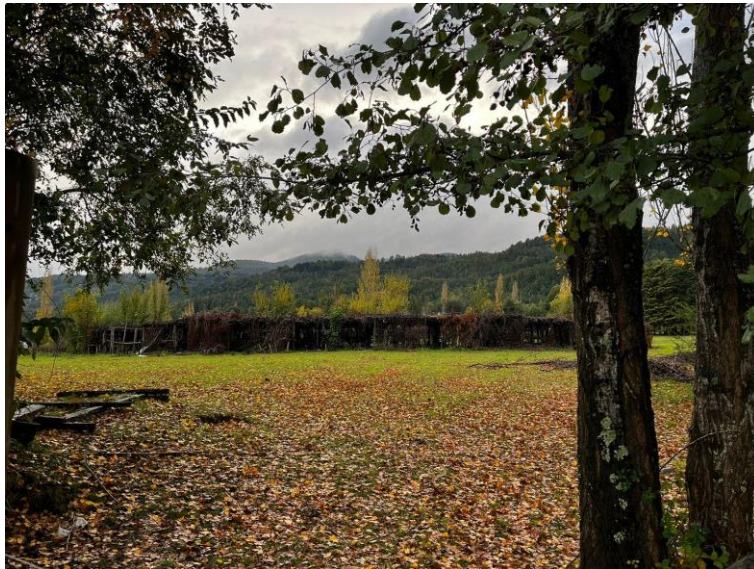
Figura 4: Terreno donde se realiza el nguillatún en Pucura.

Cremilda menciona el nivel de contaminación que el lugar puede llegar a causar, siendo utilizado unos cuantos días al año. El espacio en donde se realiza esta ceremonia se encuentra a pocos metros de distancia de la cabaña en la que nos estamos hospedando, surgen muchas dudas respecto al lugar, hay una tensión especial cada vez que rodeo los límites que demarcan sus cercas, en él no habita nadie, nadie más que un caballo que sale de repente a pastar (Véase Figura 4 con el terreno donde se realiza el nguillatún).