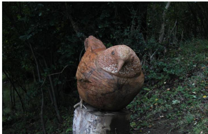
Figura 8: Escultura del Chercán. Fotografía: Fernanda Soto, Chercán, Pucura, 08 de mayo de 2024.