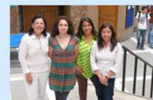
Equipo de trabajo Social

Después de 40 años de interrupción tras el golpe militar, el Senado Universitario aprobó la puesta en marcha de la carrera de Trabajo Social en la FACSO, en miras a su reapertura el año 2015.