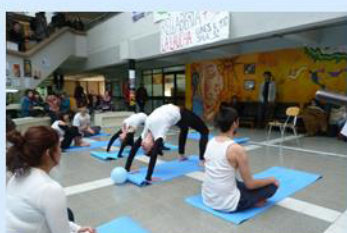
Presentación curso de Yoga