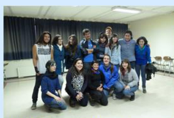
Estudiantes curso de Teatro