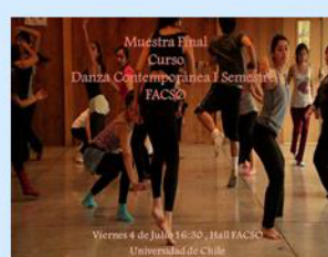
Presentación curso de Danza